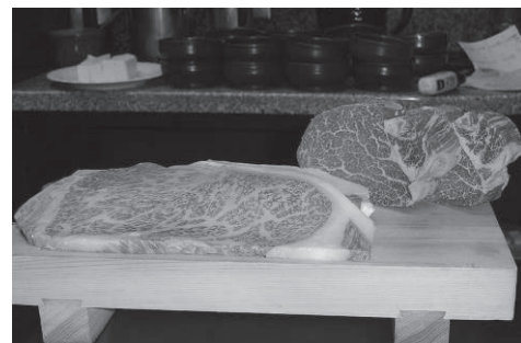
神戸ビーフは世界的にも有名

「神戸ブランド」として、神戸プリンや神戸ビーフ、神戸ワインなどは大変有名である。また、アパレルやケミカルシューズ、真珠加工などのファッション用品の産業が盛んである。六甲山系の摩耶山から望む神戸市や大阪市の夜景は「日本三大夜景」、「1000万ドルの夜景」として親しまれている。