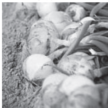
特産の淡路島たまねぎ

また、伊弉諾神宮をはじめとするパワースポット、五斗長垣内遺跡などの文化遺産も豊富である。